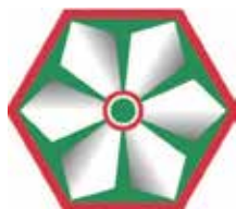
logotip Društva Dobrnič (DD)

Sem predsednica Društva Dobrnič, ki od leta 2001 skrbi za ohranjanje vrednot in dosežkov ženskega gibanja, zlasti izročila 1. kongresa Slovenske protifašistične ženske zveze (SPŽZ) in za uveljavljanje žensk v javnem življenju. Zato želim osvetliti pomen prvega kongresa žensk SŽPZ tudi za današnji čas, ki ga obvladuje globalni model družbe potrošništva in vsakdanje naglice.