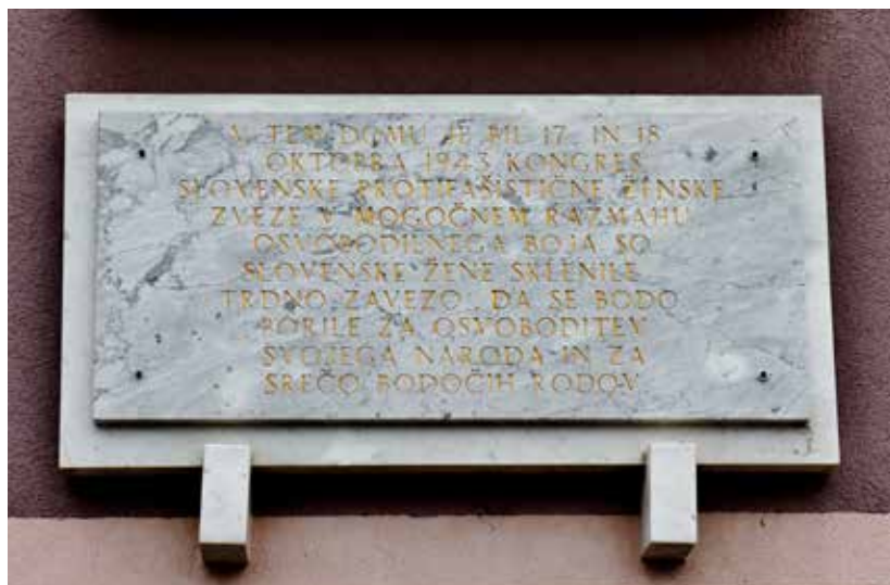
Spominska plošča na zidu Kulturnega doma v Dobrniču

Na spominski plošči na zidu Kulturnega doma je zapisano, da so se delegatke zavezale, da se bodo »BORILE ZA OSVOBODITEV SVOJEGA NARODA IN ZA SREČO BODOČIH RODOV«.