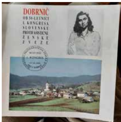
Naslovnica zbornika ob 50. obletnici prvega kongresa, 1993

uveljavljeni umetniki in kulturni delavci. Mnogi med njimi so bili člani Ljubljanske drame in Ljubljanske opere.