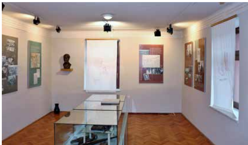
Spominska soba I. kongresa SPŽZ v Dobrniču